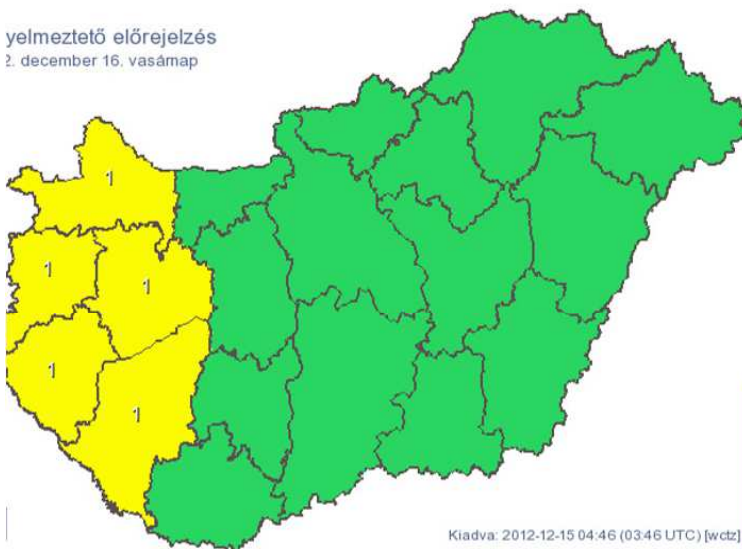
Kiadva: 2012-12-15 04:46 (03:46 UTC) [wact]

Figyelmeztető előrejelzés 2. december 16. vasárnap